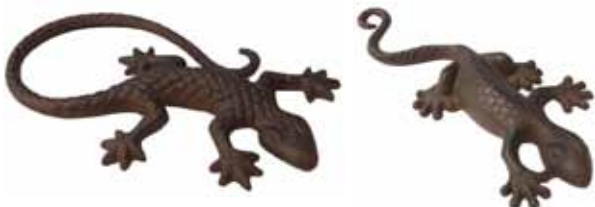
Artikkel 1512 - 1513 ØGLE, i jern Lengde: 24 cm

Materiale: Jern Høyde: 120cm Diameter: 10cm glasskule