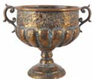
Artikkel 8157483 Chantal potte, kobbermalt metall. 36x27x H 27 cm 1 stk/pk