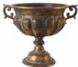
Artikkel 8157483 Chantal potte, kobbermalt metall. 33x26x H25 cm 1 stk/pk