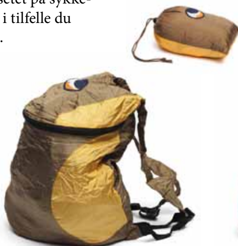
Artikkel 540837 Back Pack sekk, Brun/gul 1 stk/pk