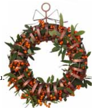
Artikkel 1527 KRANS, malt metall. Kobberfarge. Bredde: 30 cm