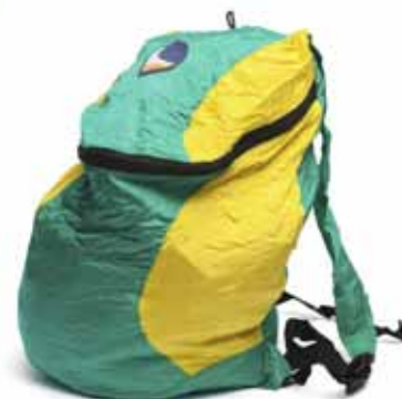
Artikkel 541140 Back Pack sekk, Grønn/gul 1 stk/pk