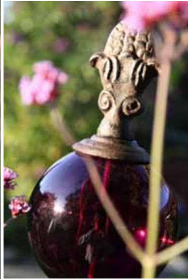
Artikkel 1763 Rosekule med kongle, rød glasskule.